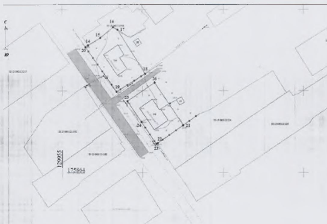
Схема проектируемого земельного участка под многоквартирным домом д. Савино, ул. Лесная, д. 171

Схема проектируемых земельных участков под многоквартирными домами д. Савино, ул. Кузнецкая, д.25, д. 27