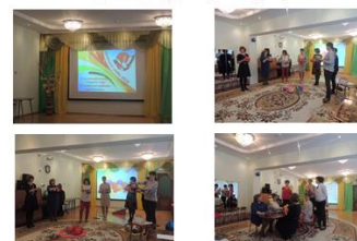
07 февраля 14-00 МБДОУ д/с №18 г. Петушки Мастер класс «Педагог года» (для педагогов ДОО)

10 февраля стартовала всероссийская массовая лыжная гонка «Лыжня России - 2019». Она прошла на стадионе «Труд» (г. Костерево). В соревнованиях приняло участие 339 человек из всех муниципальных образований Петушинского района, а также из городов: Москва, Орехово-Зуево, Одинцово, Владимир, Александров.