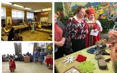
31 января 09-30 МБОУ СОШ №3 г. Петушки Семинар руководителей школьных музеев на тему: «Роль социального партнерства в духовно-нравственном воспитании детей»;