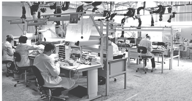
В цехе действующего предприятия НПО «Наука» в Першино.

Новый завод планируется ввести в эксплуатацию в 2019 году. При этом дополнительно появится около 400 высококвалифицированных рабочих мест,