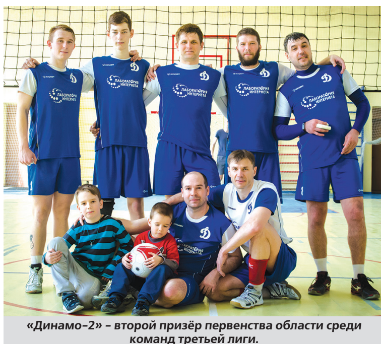
«Динамо-2» – второй призёр первенства области среди команд третьей лиги.

И наша команда приложила для решения этой задачи немалые усилия. Но одного старания оказалось мало. Динамовцы добились победы в одной партии, но общий перевес всё же оказался на стороне хозяев площадки. «КБ «Арматура» по-