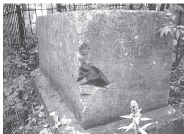
Памятник Филиппу Уткину на старообрядческом кладбище (Костерёво-1).

1666 г. по народным поверьям был «несчастливым». Собор святителей России осудил всех не покоряющихся новым обрядам и новоисправленным печатным книгам. Никон провозгласил свою церковь православной, или господствующей, а его противники, которые оста-