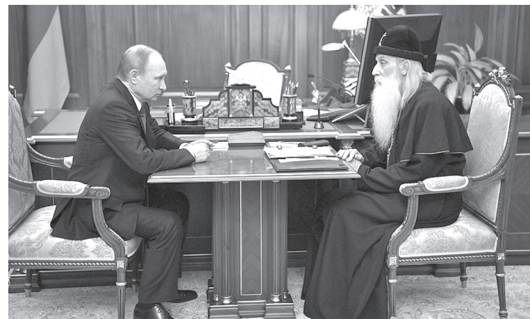
16 марта 2017 г. состоялась официальная встреча Митрополита Московского и всея Руси Корнилия с Президентом Российской Федерации В. В. Путиным.

Последним священником был отец Фёдор Анисимов, из мужиков. Он имел хороший голос и знал всю службу. Присматривал и прислуживал в церкви старичок Яков. Он был и звонарём. Жили они со старушкой напротив церкви, в избушке, вросшей в землю.