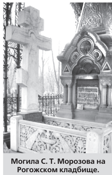
Могила С. Т. Морозова на Рогожском кладбище.

Церковь была большая, деревянная, из заклзьяменской сосны. Стены и полы, не покрашенные, отливали золотистым оттенком. На крыше установили деревянный крест и колокол. Был очень богатый