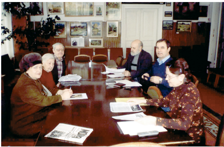
Заседание Левитановского комитета. 2008 год.