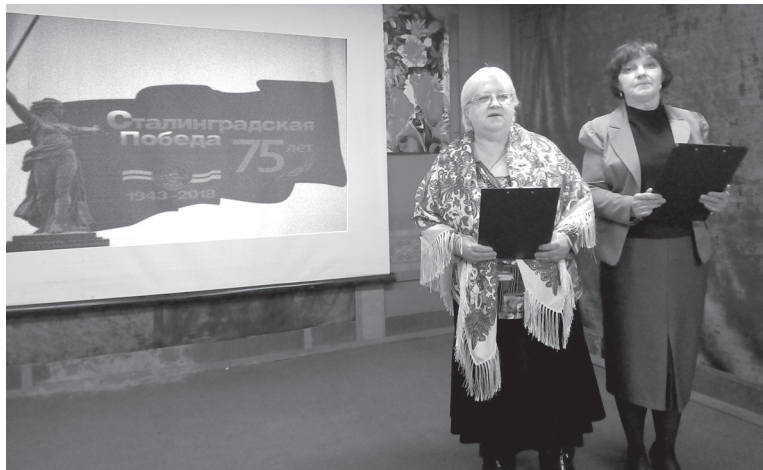
В АННИНСКОМ СЕЛЬСКОМ ДОМЕ КУЛЬТУРЫ И БИБЛИОТЕКЕ ПРОШЛА НЕДЕЛЯ ВОИНСКОЙ СЛАВЫ.

К очередной годовщине снятия блокады Ленинграда для учащихся 5 - 7 классов Аннинской средней школы был проведён час мужества под девизом «Незатихающая боль блокады». Ребятам был продемонстрирован документальный ролик «Хроника блокады» и презентация, ведущие –