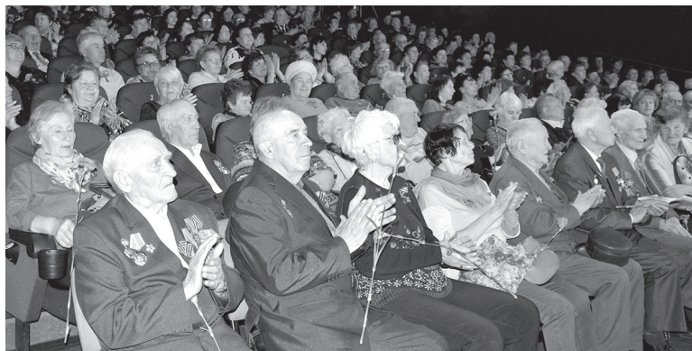
На празднике собрались более 250 ветеранов, тружеников тыла и детей войны нашего региона.