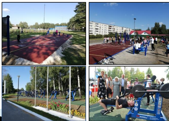
Малые спортивные площадки