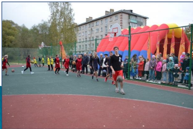
Многофункциональная игровая площадка в г.Костерево