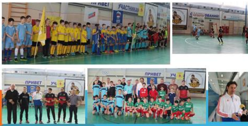
ОТКРЫТЫЙ ТУРНИР ПО МИНИ-ФУТБОЛУ СРЕДИ ЮНОШЕСКИХ КОМАНД «КУБОК ЛОКО-ИНТЕРНЕТНА». 07.03.2020, ПЕТУШКИ

7 марта в спортивном зале физкультурно-оздоровительного комплекса «ОЛИМПИЕЦ» состоялся турнир по мини-футболу среди юношеских команд «Кубок Локо-интернешнл».