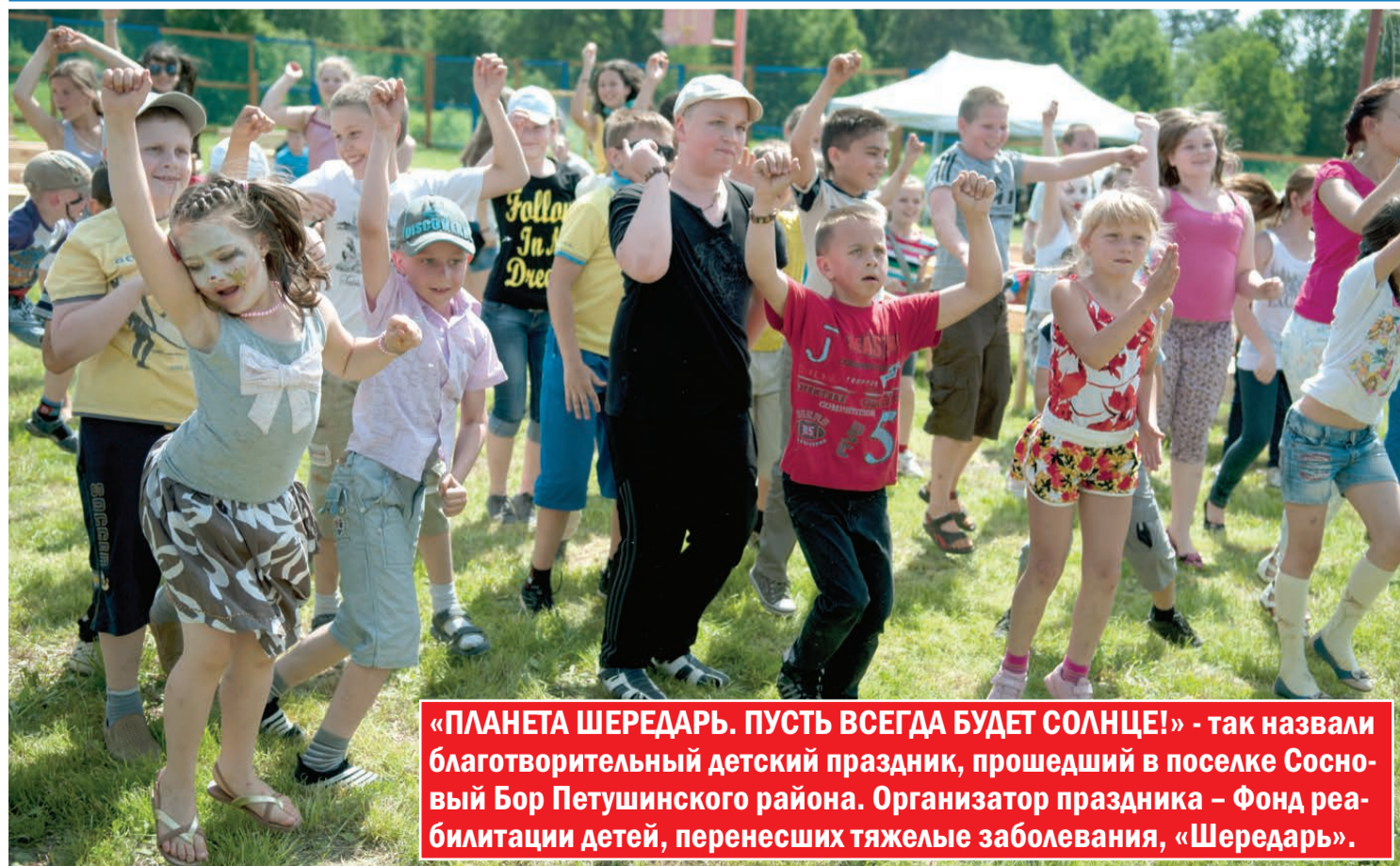
«ПЛАНЕТА ШЕРЕДАРЬ. ПУСТЬ ВСЕГДА БУДЕТ СОЛНЦЕ!» - так назвали благотворительный детский праздник, прошедший в поселке Сосновый Бор Петушинского района. Организатор праздника — Фонд реабилитации детей, перенесших тяжелые заболевания, «Шередарь».

На один день, все попали на замечательную планету, добрую, дружную, жизнерадостную, имя которой — Шередарь! И пусть на ней всегда будет солнце!